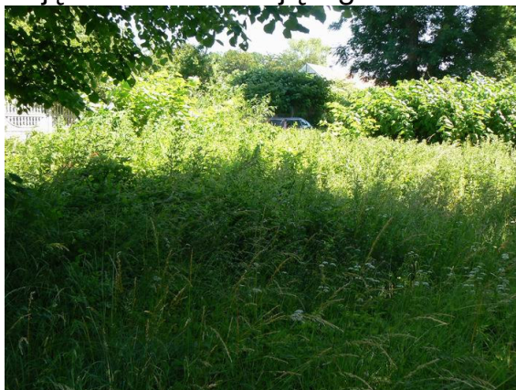
Widok od strony zachodniej Teren pod boisko wielofunkcyjne