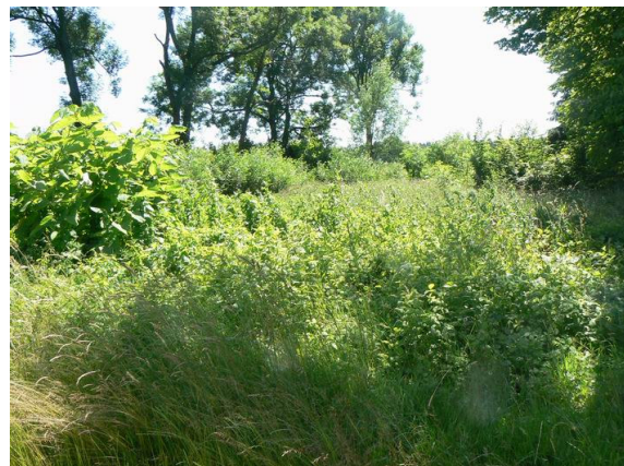
Widok od strony północnej