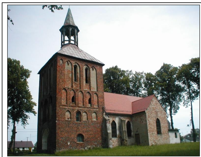
Zdjęcie 1. Kościół filialny

Dokonane odkrycia czynią kościół w Czerninie jedną z najbardziej interesujących gotyckich świątyń Pomorza. Zachowany zabytkowy wystrój wnętrza stanowią: barokowy ołtarz, datowany na XVIII wiek, z płaskorzeźbą Ostatniej Wieczerzy oraz ambona (XVII wiek). L. Boettger przeprowadzający inwentaryzację w 1890 r. za godne odnotowania uznał trzy ośmioramienne korony mosiężne, dwie drewniane figury: NMP z Dzieciątkiem i św. Katarzyny z kołem oraz trzy średniowieczne dzwony. Pierwotne wezwanie kościoła nie jest znane. Do 1945 r. kościół w Czerninie pełnił funkcję świątyni parafialnej. Po 1945 r. utracił swoją dawną rangę i stał się filią parafii w Dygowie. Został poświęcony 10 marca 1946 roku jako kościół pod wezwaniem Wniebowzięcia Najświętszej Maryi Panny.