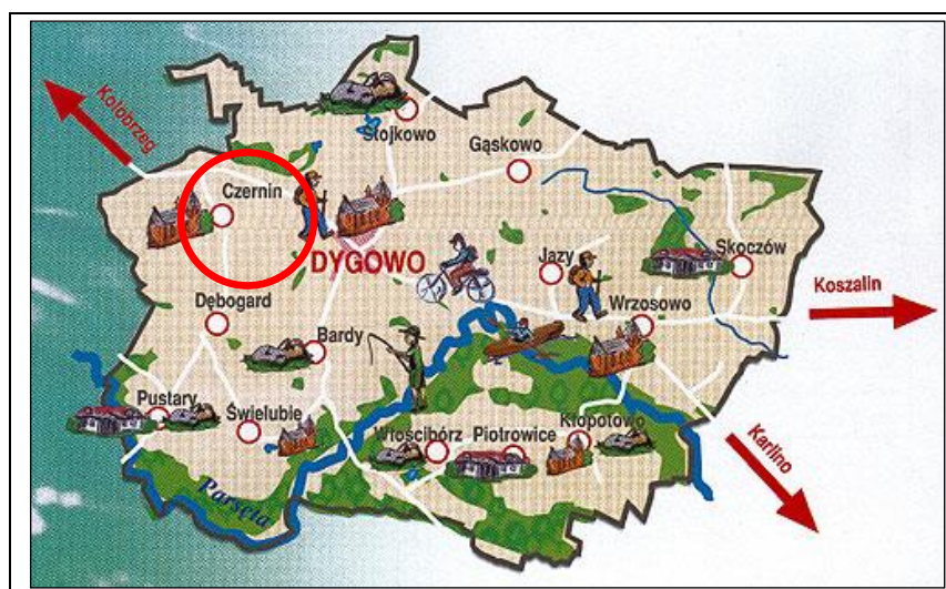
Rys. 1 Położenie miejscowości Czernin na tle gminy Dygowo

Lokalizację miejscowości na tle gminy przedstawia rysunek poniżej: