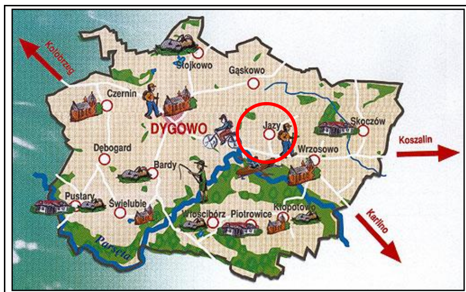
Rys. 1 Położenie miejscowości Jazy na tle gminy Dygowo

Miejscowość Jazy położona jest w środkowo – wschodniej części gminy Dygowo, w odległości ok. 5 km od Dygowa (siedziby władz gminy) i około 17 km od Kołobrzegu (siedziby władz powiatu). Odległości od innych ważniejszych miast regionu wynoszą: od Koszalina – 42 km, od Świdwina – 40 km, a od Białogardu 25 km. Miejscowość usytuowana jest na szlaku komunikacyjnym o znaczeniu gminnym, administrowanym przez Gminę Dygowo. Lokalizację miejscowości na tle gminy przedstawia rysunek poniżej.