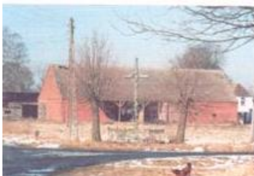
Rys. 2 Przydrożna kapliczka w miejscowości Jazy

bardzo ważne dla mieszkańców miejscowości, dlatego należy zadbać o to, by mogło w przyszłości pełnić rolę skweru.