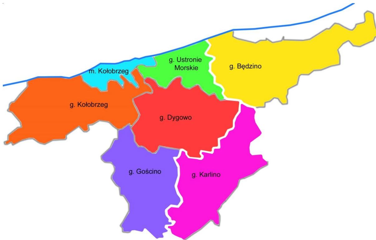
Rysunek 1. Gmina Dygowo i gminy sąsiadujące (opracowanie własne)

Gmina Dygowo jest gminą wiejską położoną w północno-zachodniej części województwa zachodniopomorskiego, w powiecie kołobrzeskim. Sąsiaduje z gminami wiejskimi: Ustronie Morskie, Będzino, Gościno, Kołobrzeg i gminą miejsko-wiejską Karlino. Powierzchnia gminy wynosząca 12 852 ha, co pozwala zaliczyć ją do najmniejszych terytorialnie gmin województwa zachodniopomorskiego.